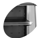
Tablettes réglables avec fonction de basculement